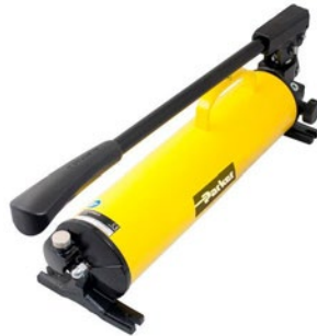
Handpumpe 85CE-OHP (für KarryKrimp 1 und 2)