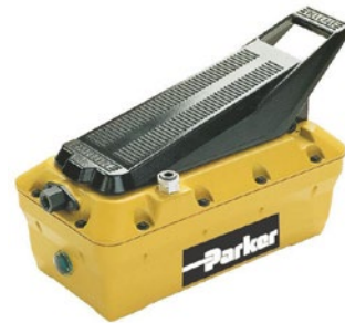
Turbo Air Pumpe 85C-OAP (für KarryKrimp 1 und 2)