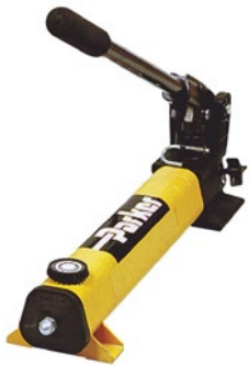
Handpumpe 82C-2HP (nur für KarryKrimp 1)