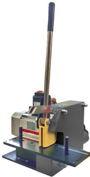
Schneidemaschine TH 3-E-EM3